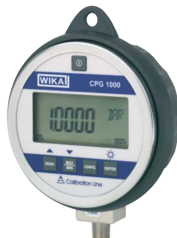
Высокоточный цифровой манометр CPG1000 с дополнительным защитным резиновым кожухом