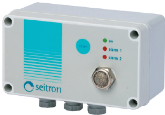
Рис.1 Внешний вид